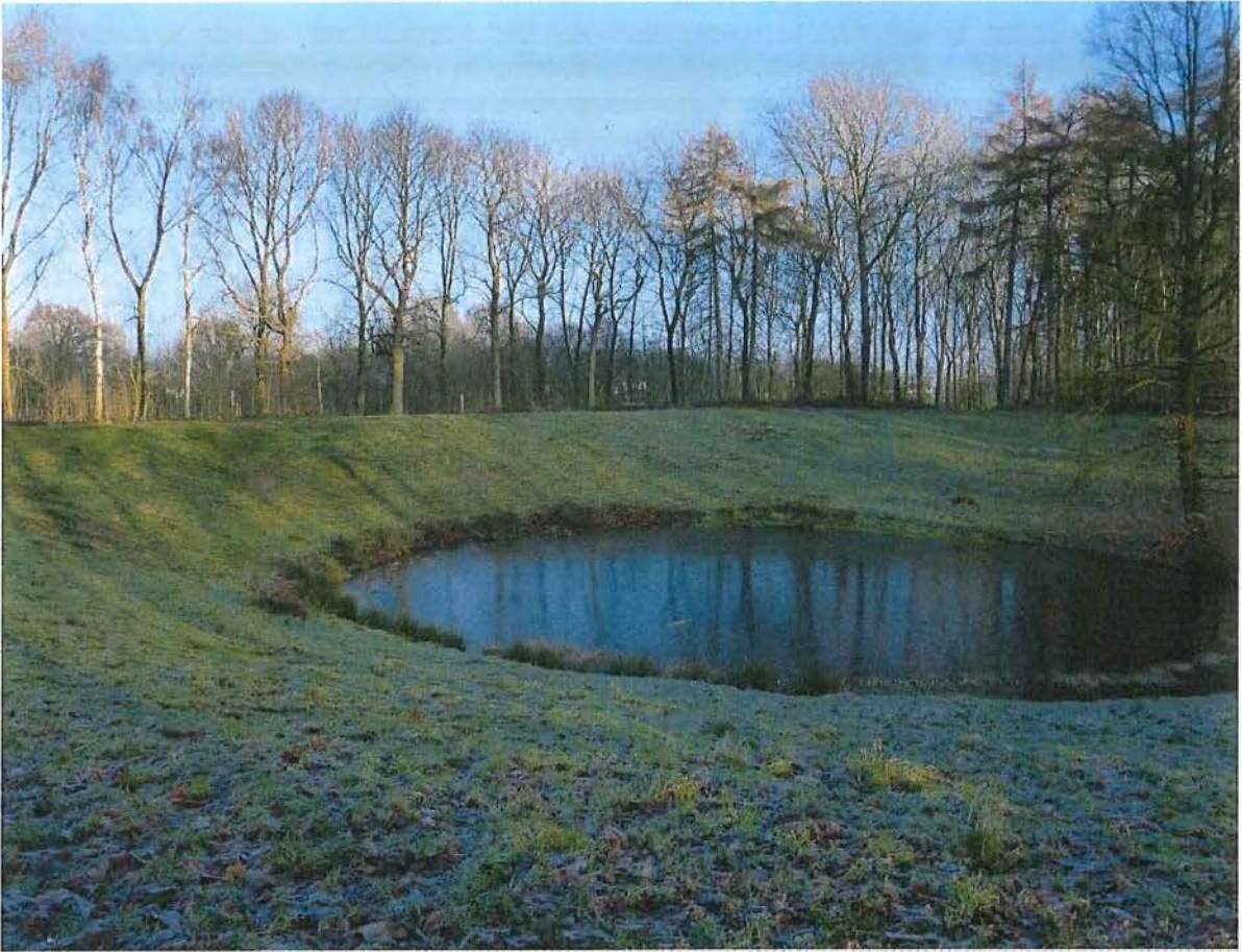
3. Caterpillar mijnkrater van 7 juni 1917, 17/01/2017