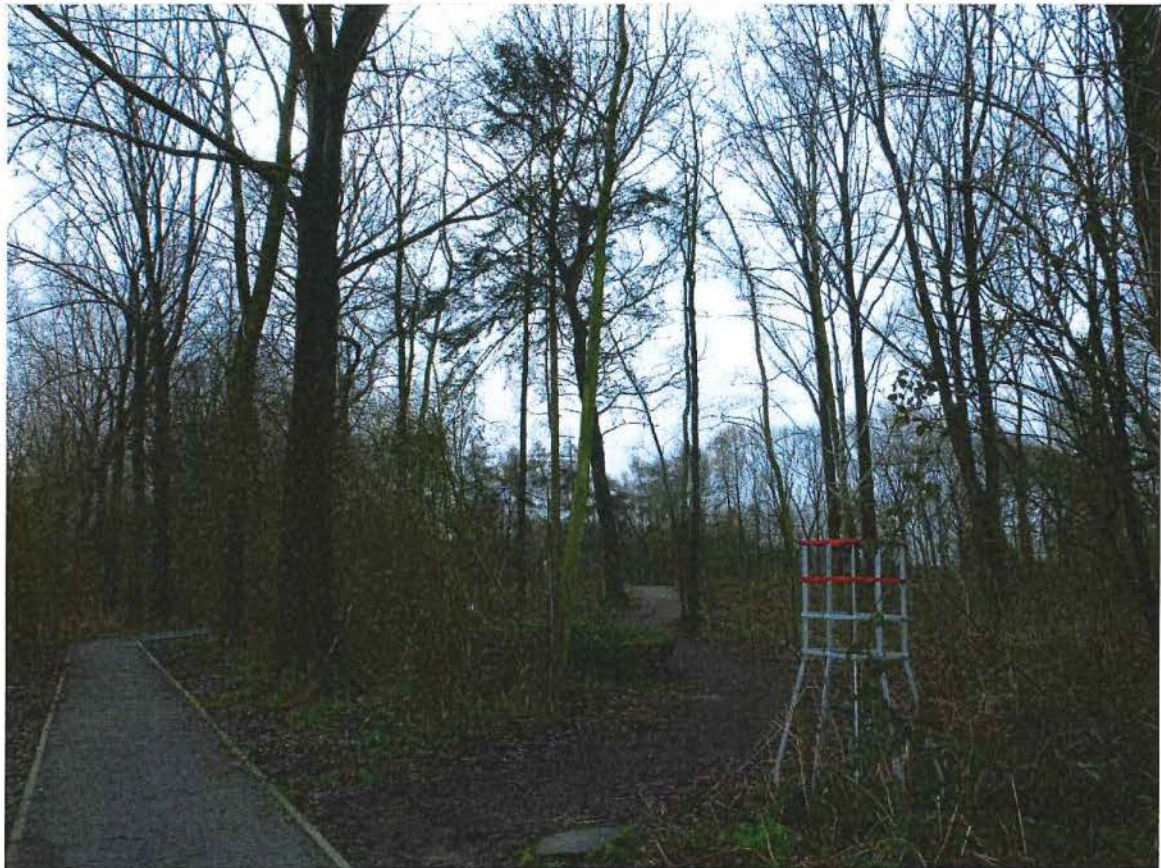
5. Pad (links) vanaf de Zwarteleenstraat naar de Caterpillar, merk de herdenkingsboom met rood gerande boomkorf op die de ligging van de Duitse frontlinie markeert, 3/03/2017