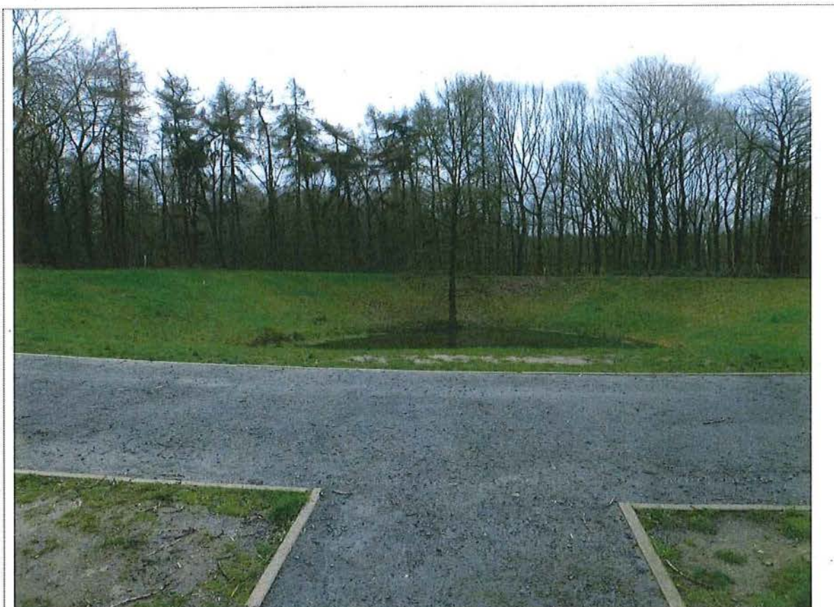
7. Pad bovenop de kraterlip, aangelegd in 2014-15, 3/03/2017