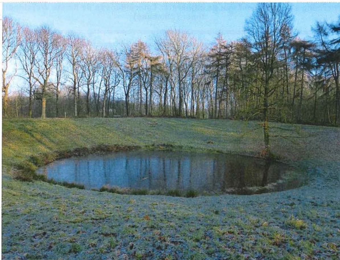
1. Kratermond van de Caterpillar met waterplas. Met uitzondering van één exemplaar op de rand van het water zijn de bomen uit de krater verwijderd. De stompen steken nog boven het maaiveld uit, 17/01/2017