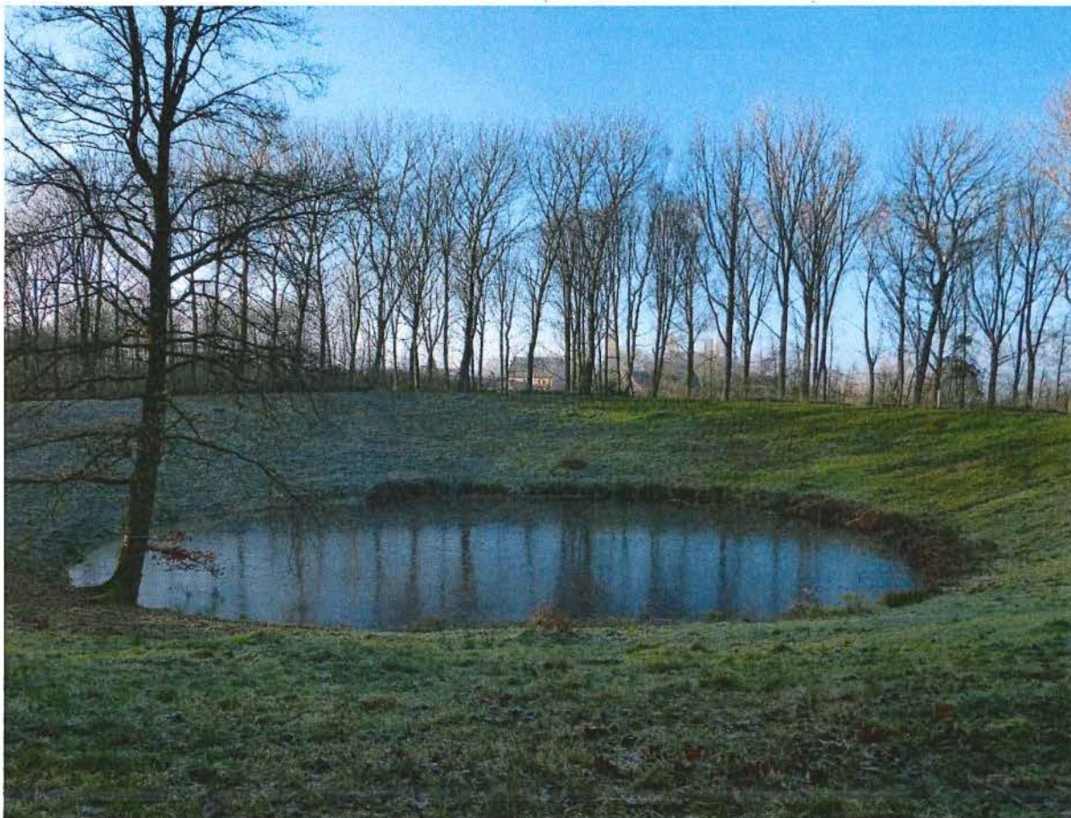
2. Zicht op de Caterpillar met de bebouwing langs de Zwarteleenstraat in de achtergrond, 17/01/2017