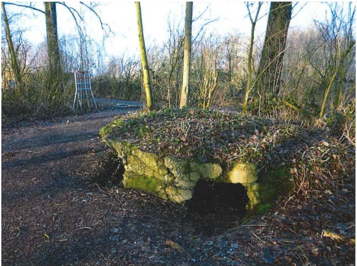
6. Bunker langs het toegangspad naar de Caterpillar, 17/01/2017