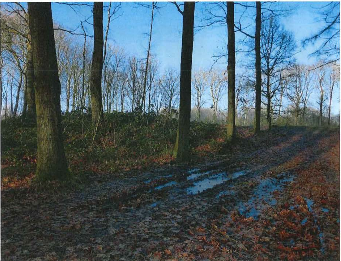
4. Zicht op de kraterlip langs het zuidoosten, 17/01/2017