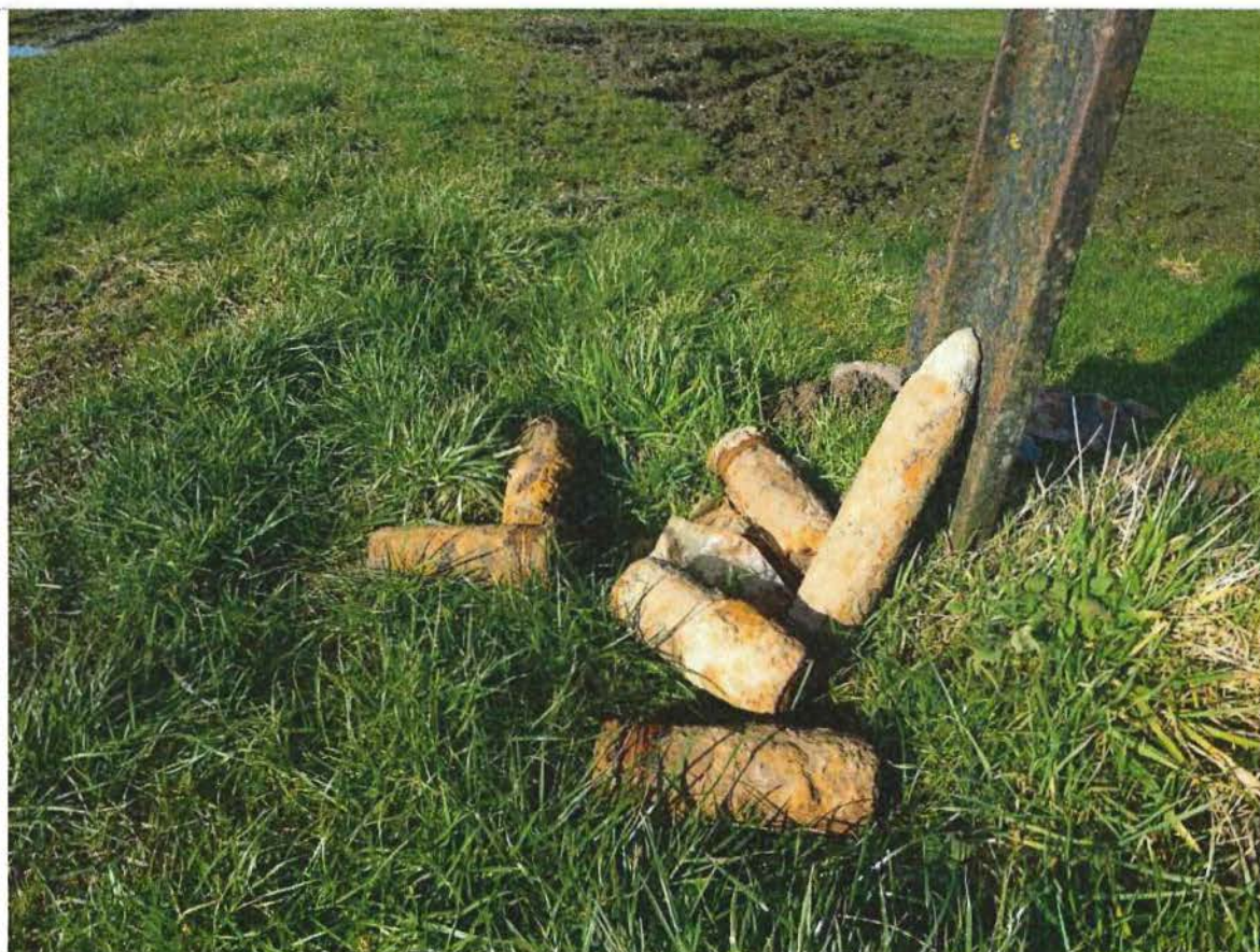
10. Opgegraven munitie langs de toegang van de kratersite bij Kruisstraat, klaar om opgehaald te worden door DOVO, 2/02/2017