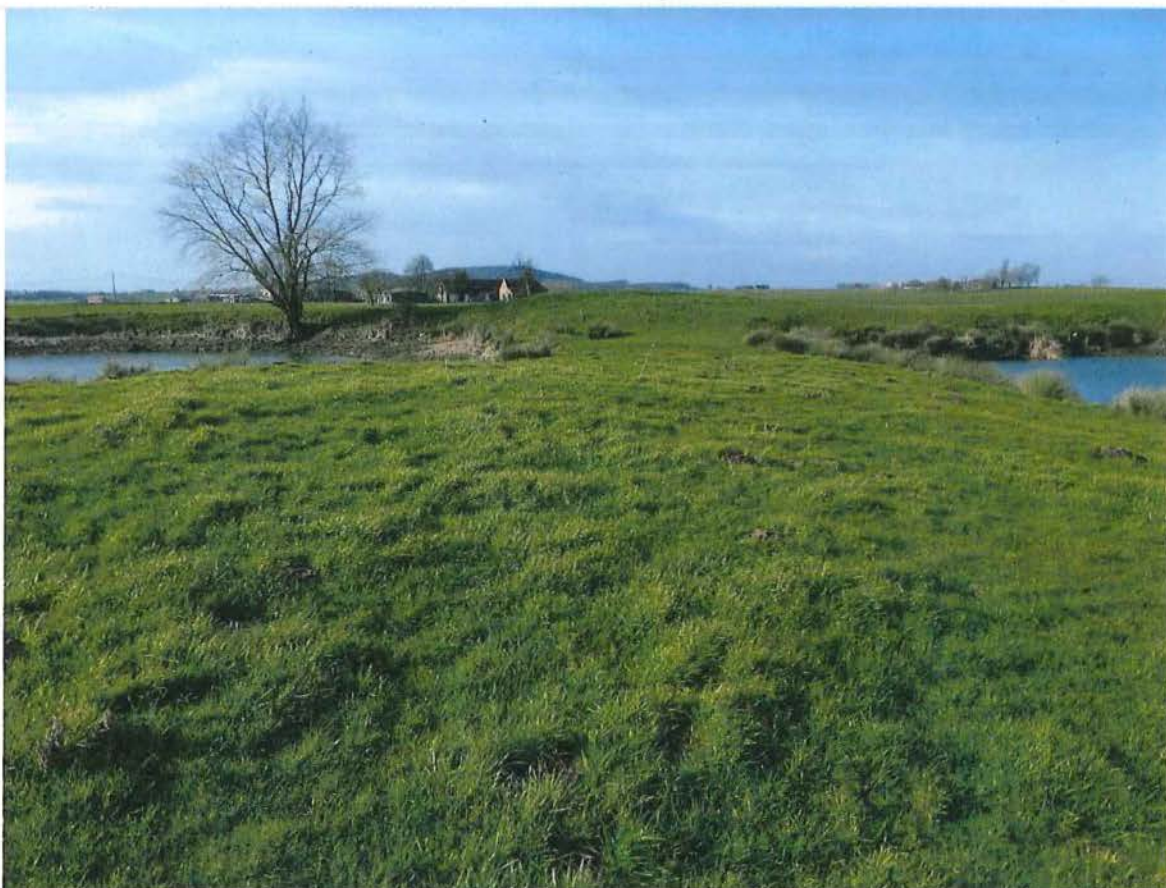
3. Links krater 1 en rechts krater 2 van mijnkratersite Kruisstraat. Met de Kemmelberg in de achtergrond, 2/02/2017