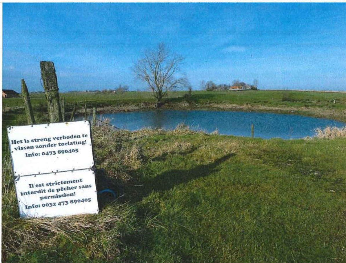
1. Mijnkrater 1 van de site genaamd Kruisstraat, foto gemaakt bij de toegang via de Wulvergemstraat, 2/02/2017