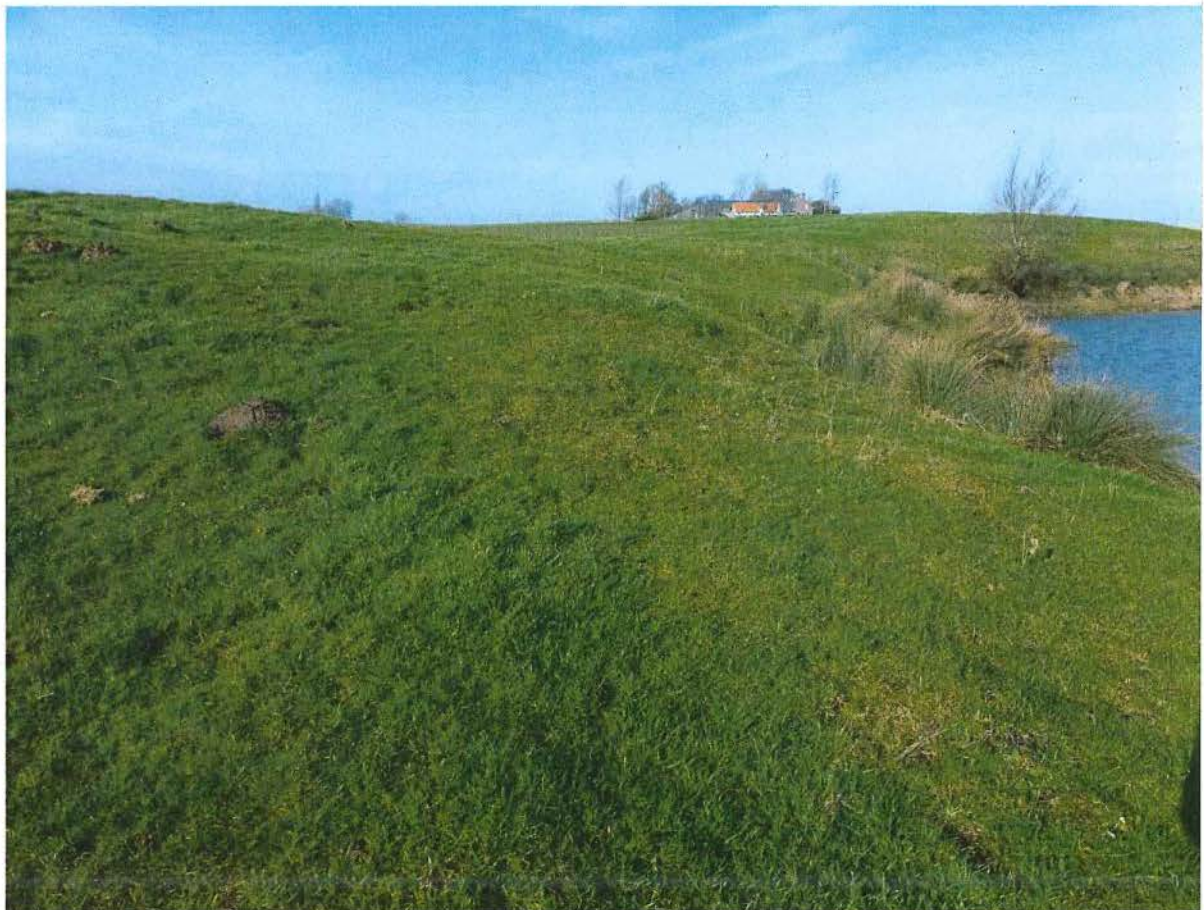
6. Het reliëfrijke grasland ten westen van krater 2, 2/02/2017