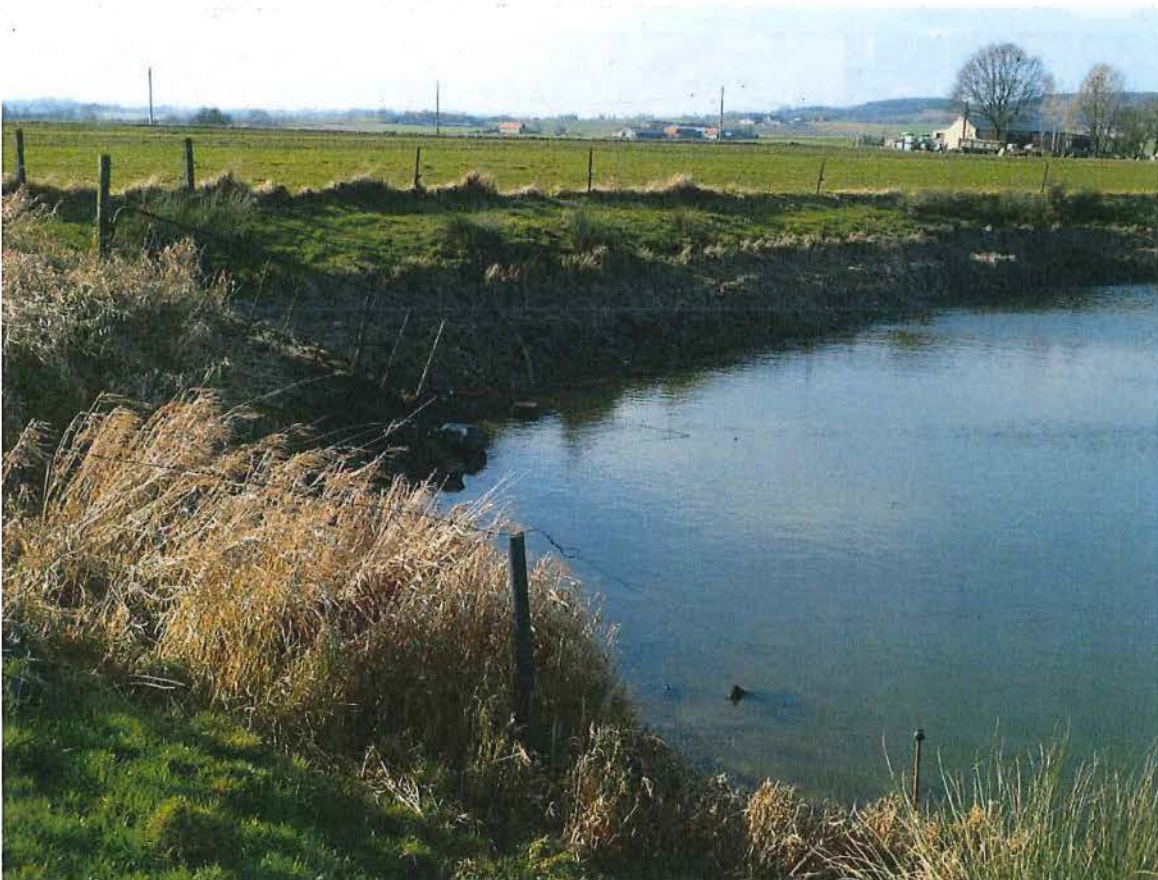
8. De zuidwestelijke rand van krater 1 van de mijnkratersite Kruisstraat. Prikkelendraad op de kraterwand belet de doorgang van het vee, 2/02/2017