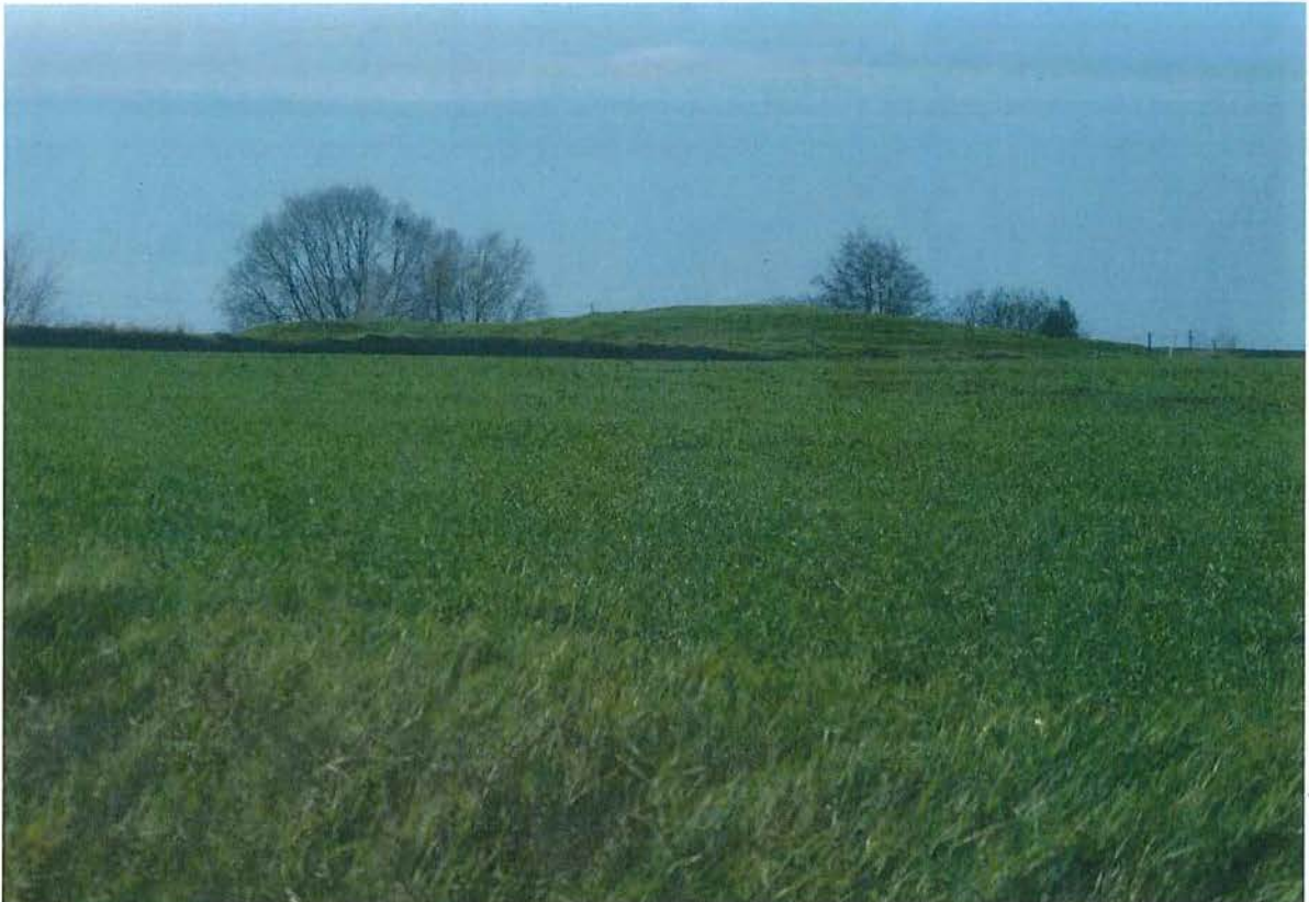
7. Zicht vanaf de Wulvergemstraat op de kraterlip van krater 2. De donkere lijn links op de foto geeft duidelijk weer dat de kraterlip daar voor een deel is afgegraven, 2/02/2017