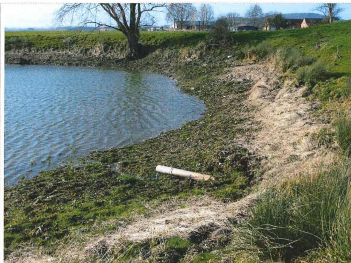
9. De noordelijke kraterwand van krater 1. Een buis zorgt voor een overloop van het waterniveau tussen de twee kraters , 2/02/2017