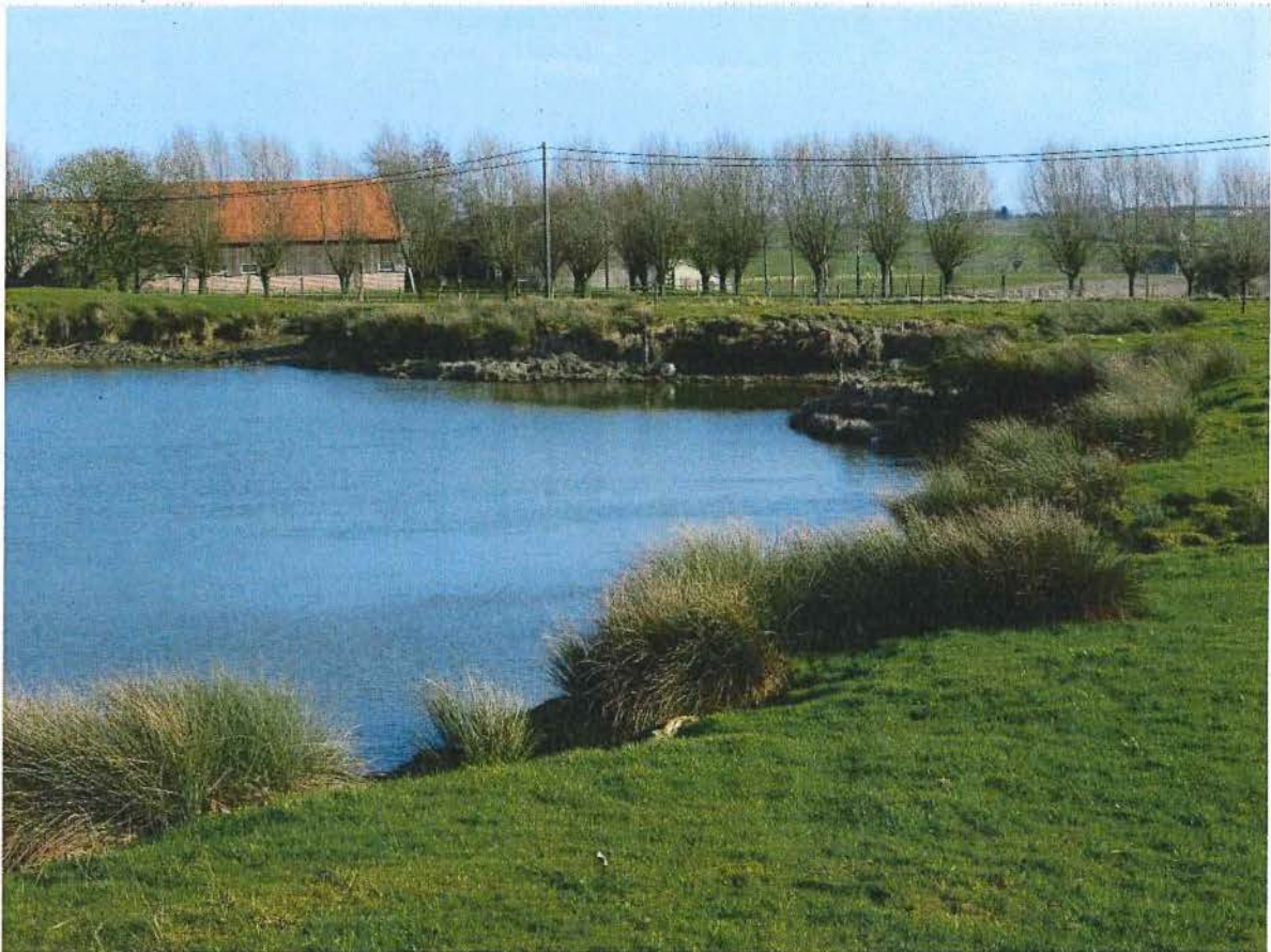
5. Oostelijke rand van krater 2 van mijnkratersite bij Kruisstraat. De bomenrij (rechts) bij de hoeve in de achtergrond (Wulvergemstraat 29) markeert de ligging van de Duitse diepe mijnschacht Ferdinand I, 2/02/2017