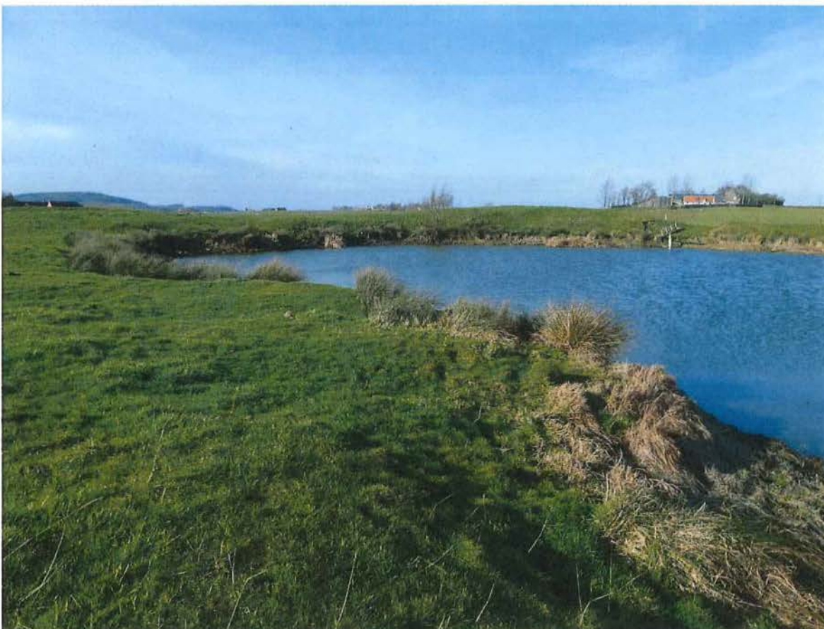
4. Westelijke rand van krater 2 van de mijnkratersite bij Kruisstraat. Op de kraterwand groeit pitrus, 2/02/2017