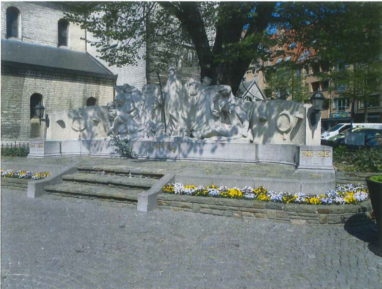
Gedenkteken tijdens lente met zon- en schaduwspel 23/04/2015