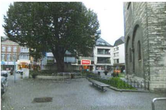
Zicht op de achterzijde van het oorlogsdenkenken en de 'verrommelde', kleine en onaantrekkelijke pleinruimte