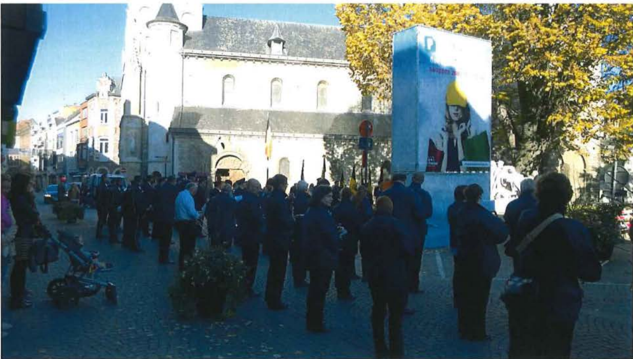
Gedenkteken tijdens herdenkingsmoment 1/11/2015