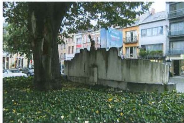
Achterzijde van oorlogsgedenkteen