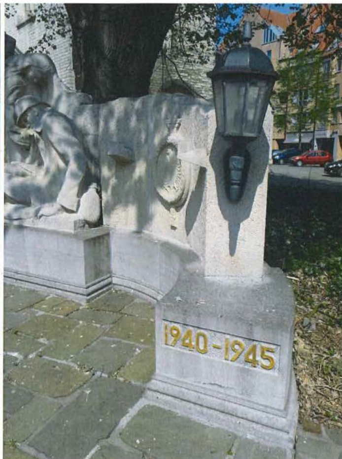
Latere toevoegingen