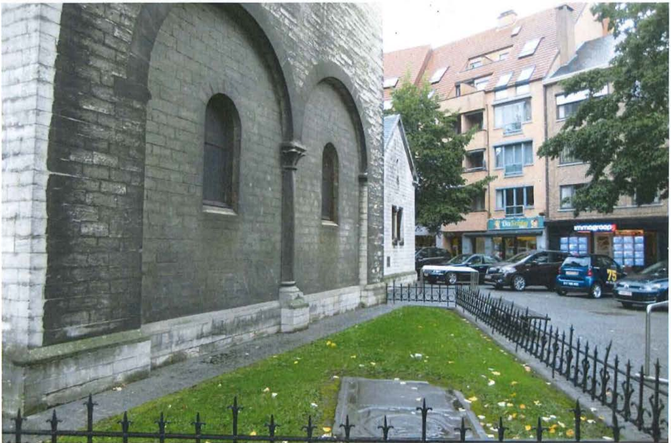
Plaats waarheen het oorlogsgedenkteken gepland werd