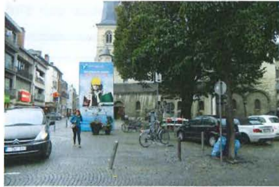
Zicht op Sint-Martenplein (rechts), Stapelstraat (links), oorlogsdenkenken en Sint-Maartenkerk