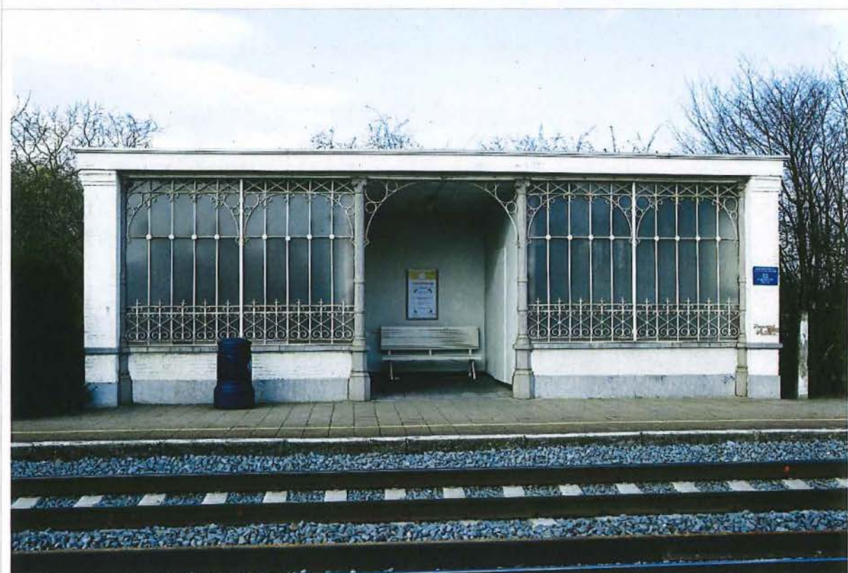
4. schuilhokje, 28/03/2017