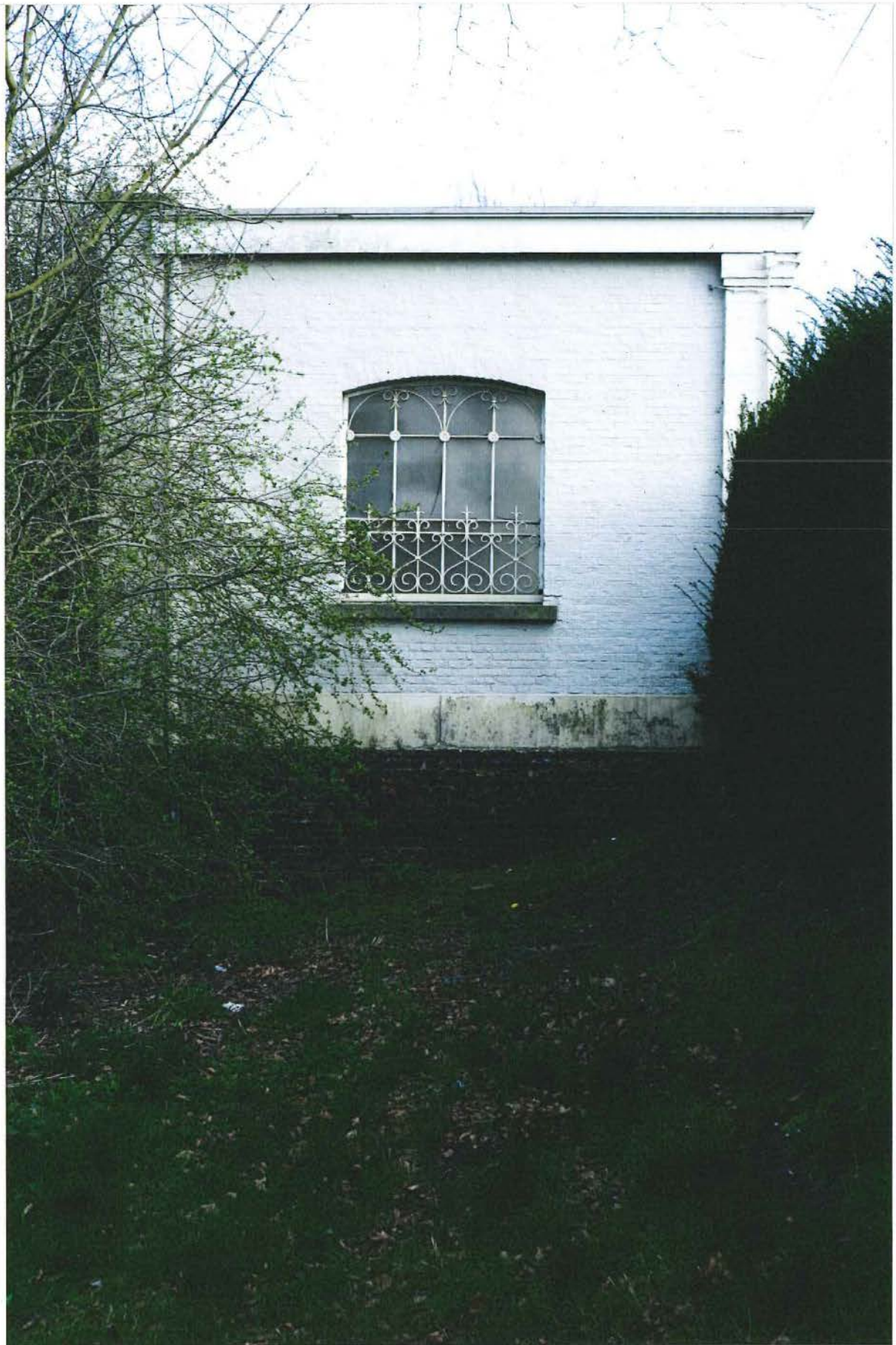
5. schuilhokje, linkerzijgevel, 28/03/2017