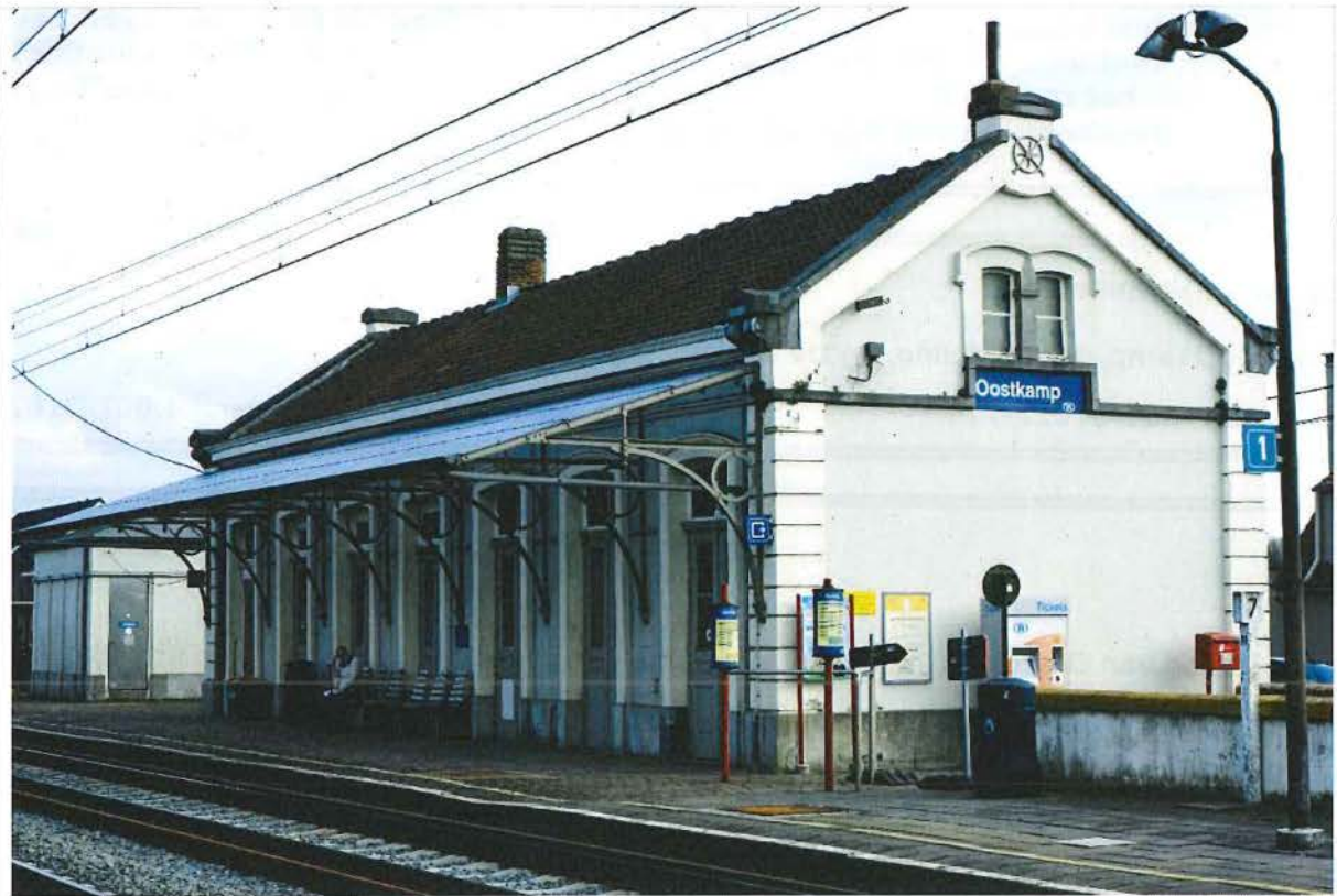
1. Stationsgebouw met luifel, zicht op spoorgevel en zijgevel, 28/03/2017