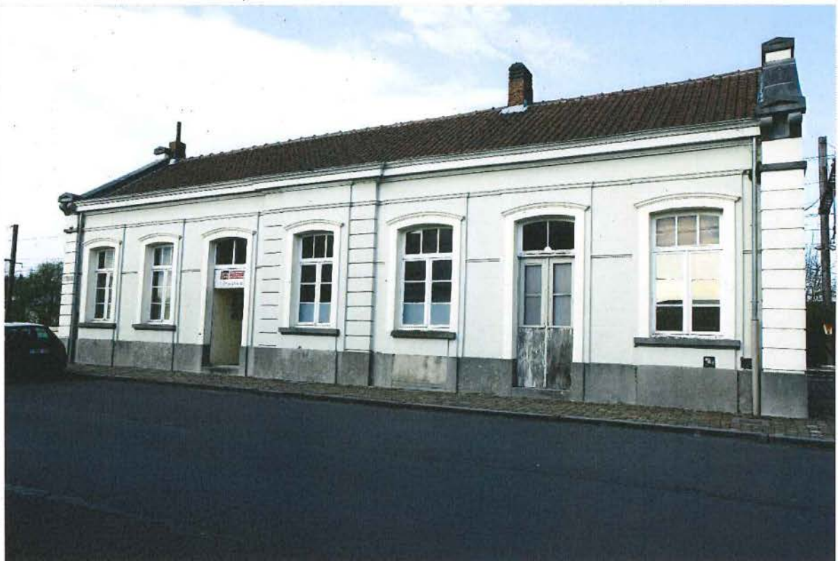
2. Stationsgebouw straatgevel, 28/03/2017