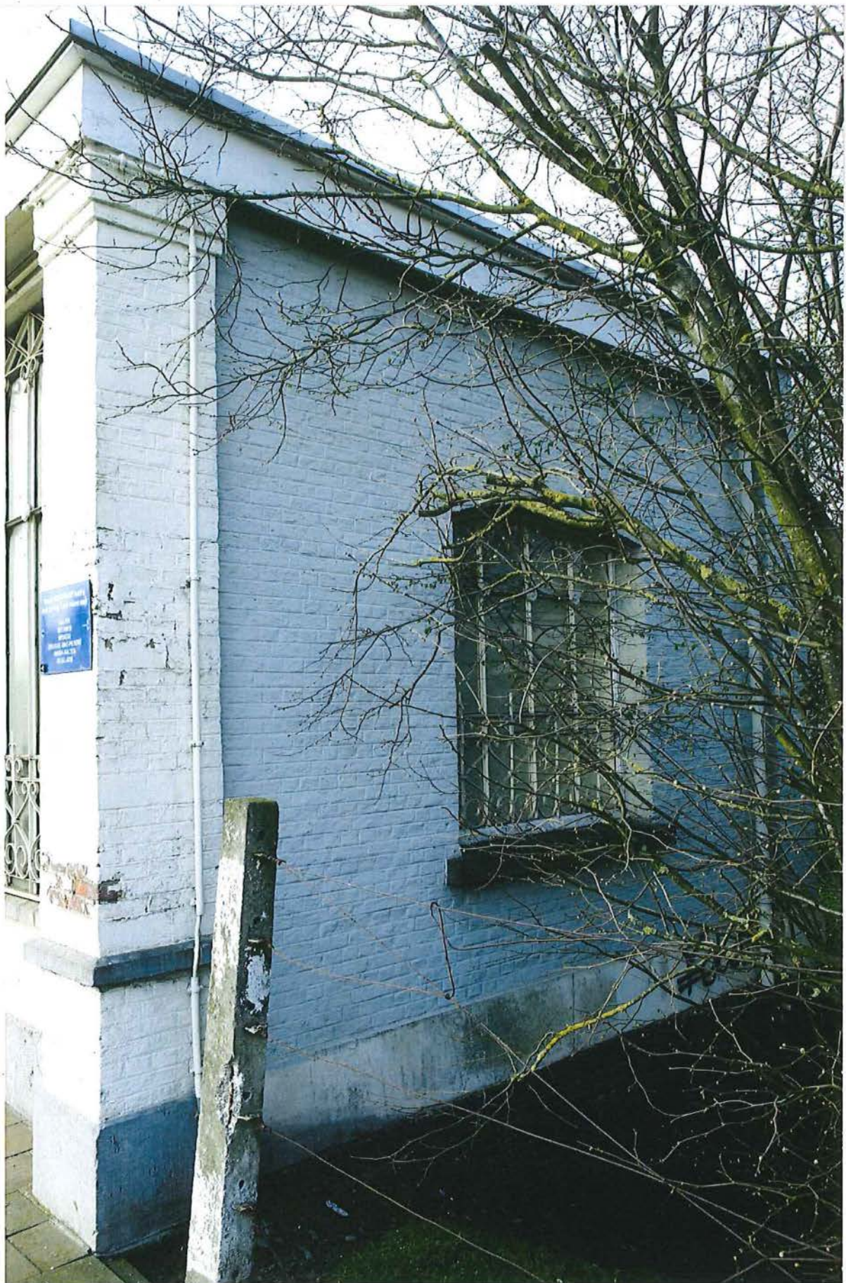
6. schuilhokje rechterzijgevel, 28/03/2017