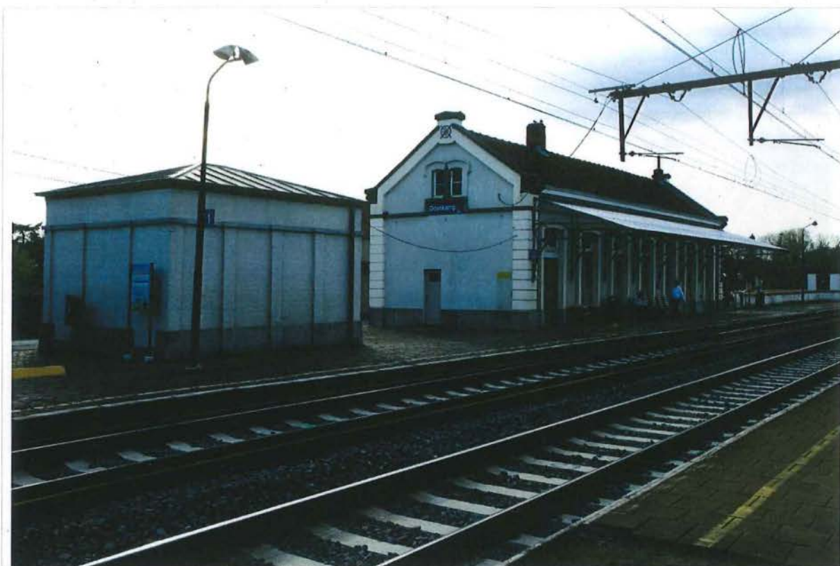
3. links: dienstgebouw (bescherming op te heffen), station (te verplaatsen), 28/03/2017