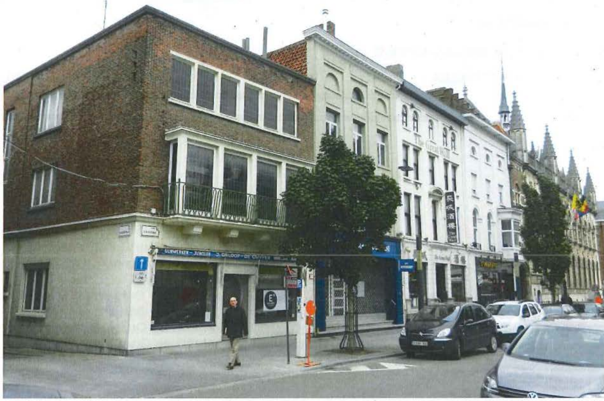
Foto 1: de noordelijke gevelrij van de Rijselsestraat. Van links naar rechts: Rijselsestraat 8, 6, 4, 2 en het stadhuis.