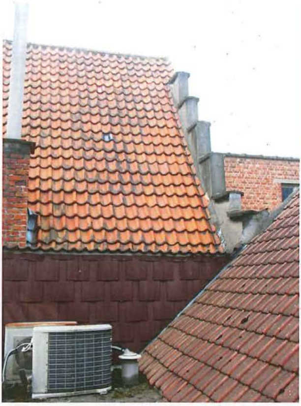
Foto 4: zicht op de oostelijke langsmuur en trapgevel van het huis De Croone.