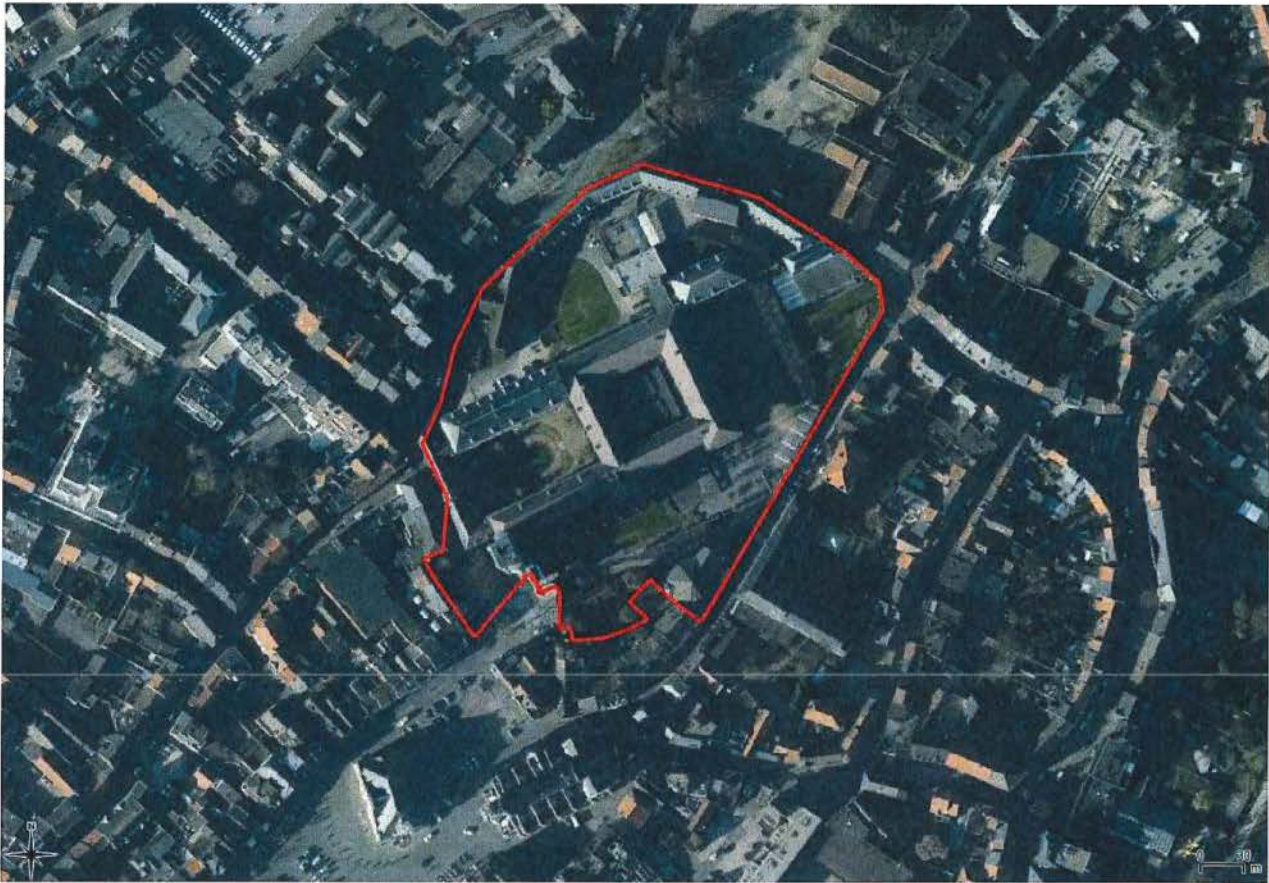
Orthofoto (winteropname 2015) met aanduiding van de te beschermen zone