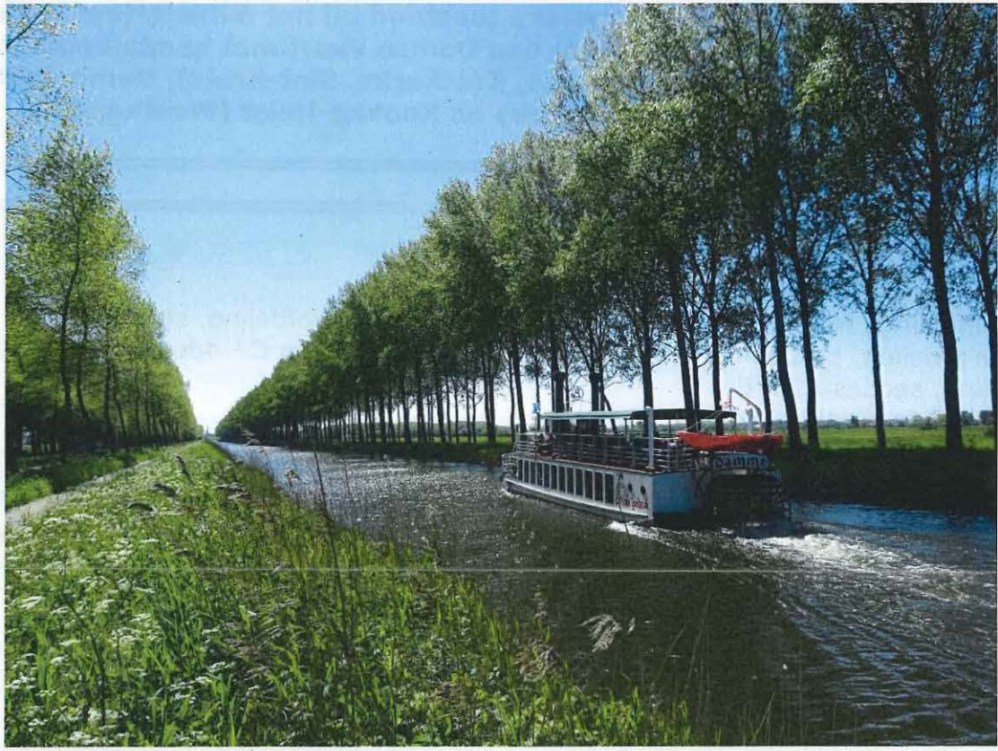
Foto 1: Algemeen zicht op het kanaalsegment tussen Brugge en Damme