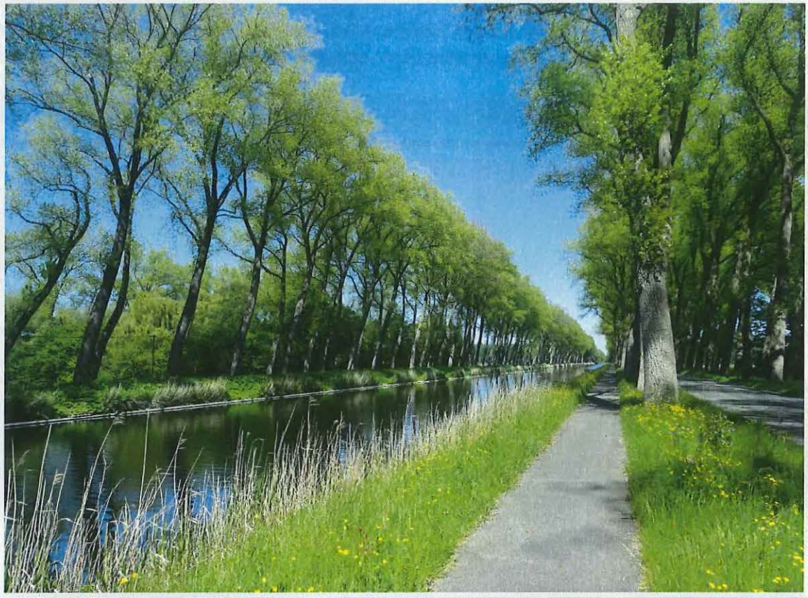
Foto 3: Algemeen zicht op het kanaalsegment tussen Damme en Sluis