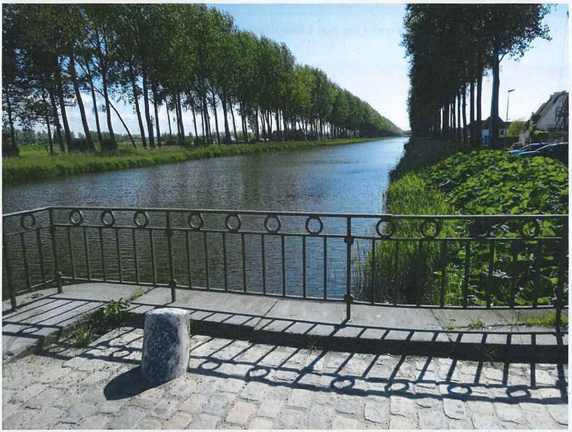
Foto 7: Smeedijzeren afsluiting en schamppaal bij de kanaalbrug van Hoeke