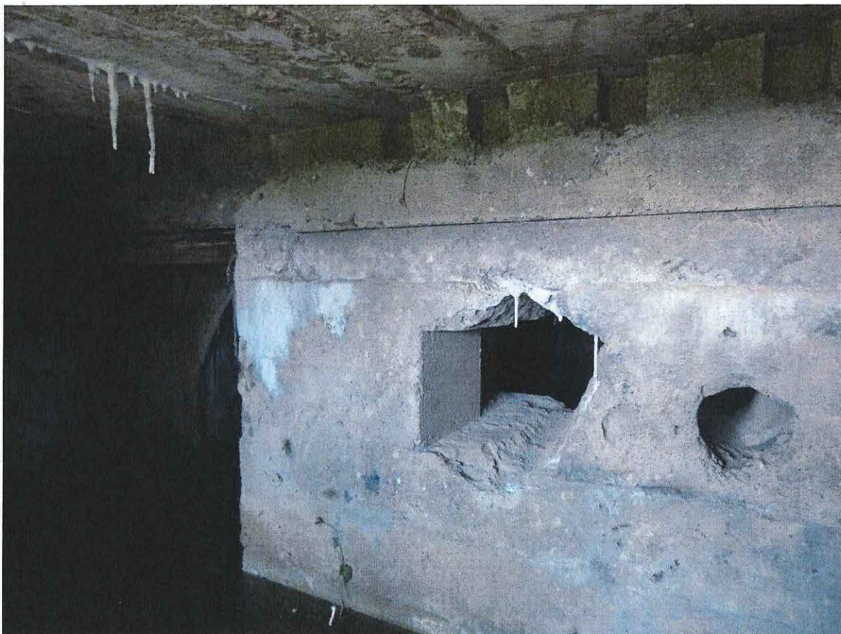
Foto 5: Twee openingen in de tussenmuur, ter hoogte van de rechertoegang.