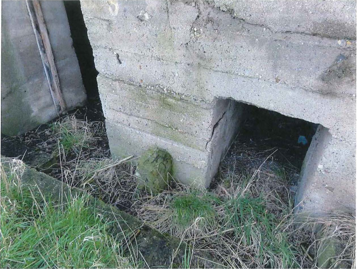
Foto 3: Betonnen muurtje bij de rechertoegang en toegang tot het mangat.