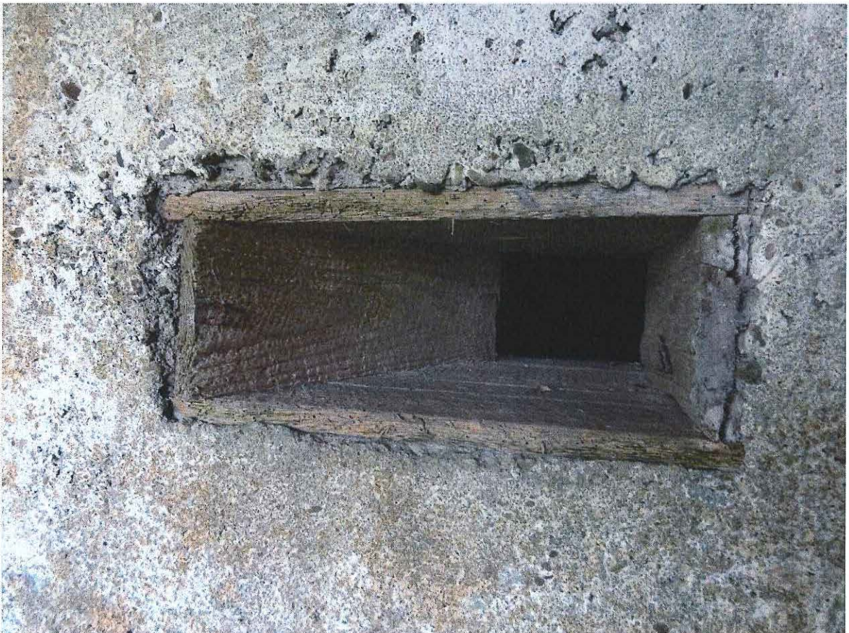
Foto 6: Een met hout beklede schietopening in de binnenmuur ter hoogte van de toegang.