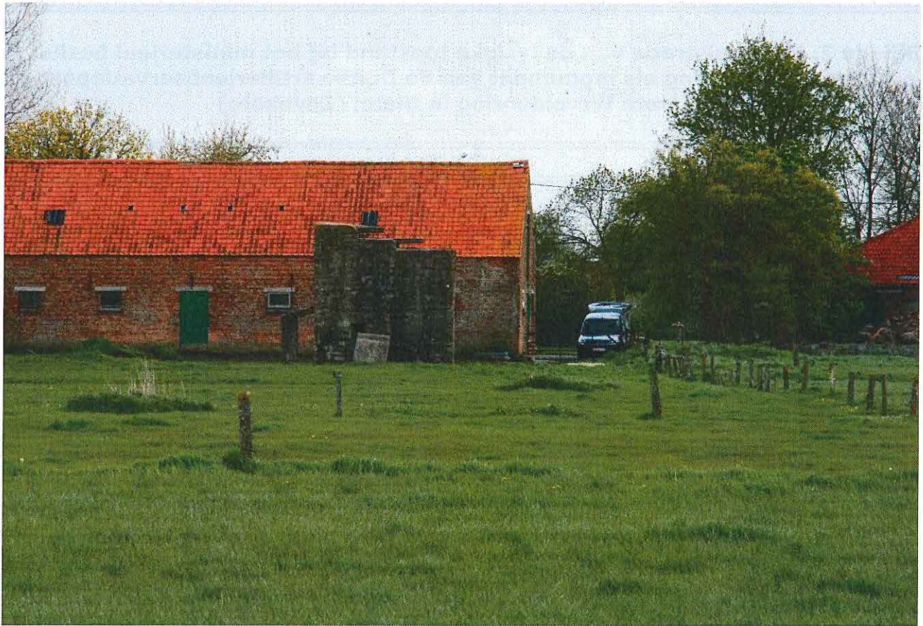
Foto 1: Zicht op de artillerieobservatiepost vanuit noordelijke richting.