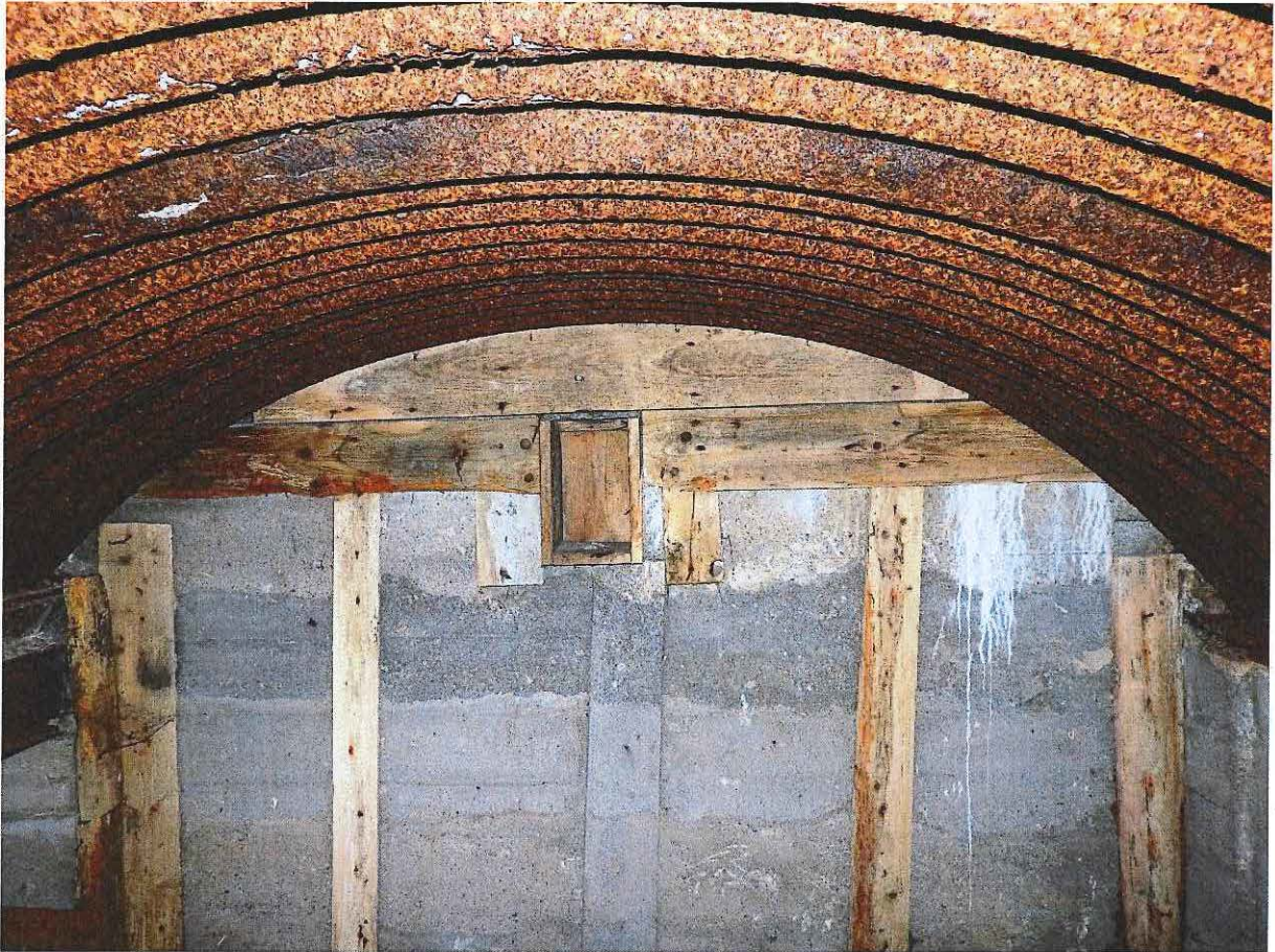
Foto 5: Houten nisje voor lamp in de rechtse ruimte. Het plafond van de ruimtes bestaat uit zogenaamde Wellblechbogen (gebogen gegolfd plaatijzers).