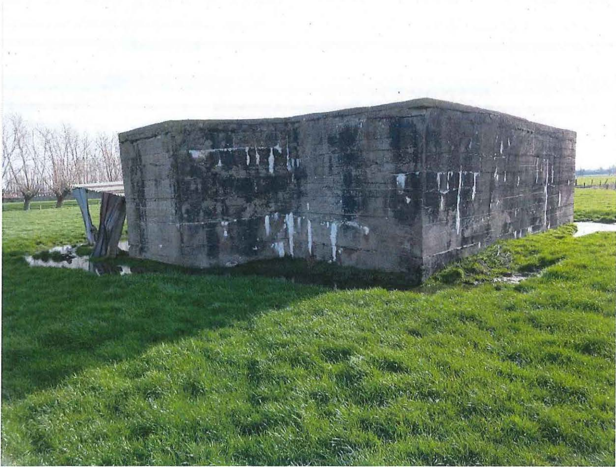
Foto 3: De noordwestelijke en zuidwestelijke zijde van de bunker.