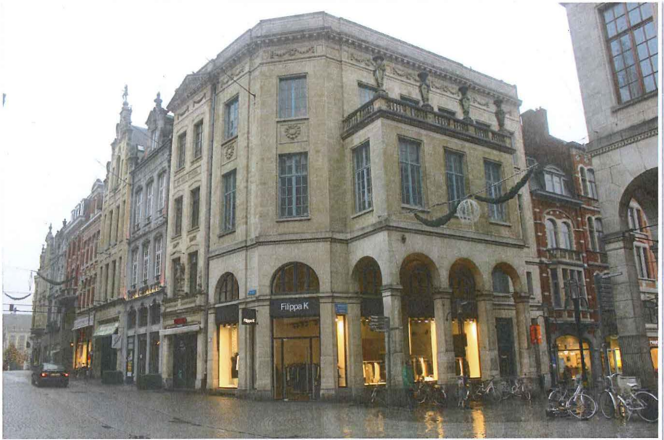
Foto 10: Leuven, Grote Markt - zicht op de westelijke pleinwand met aanzet van de Brusselsestraat (rechts)