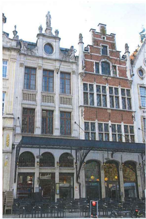
Foto 7: Leuven, Grote Markt 11 (links) en 12 (rechts) Notre Dame en de Moriaen/Café Lyrique