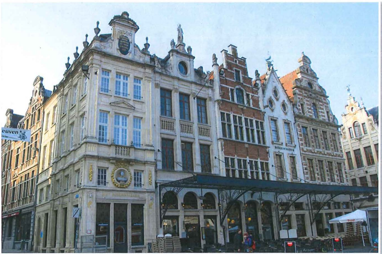
Foto 4: Leuven, Grote Markt - zicht op de zuidelijke pleinwand, panden Grote Markt nummers. 11 (links) tot 13 (rechts)