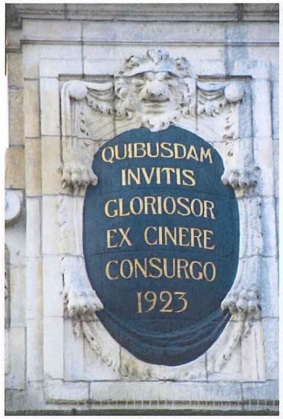
Foto 6: Leuven, Grote Markt 11, Het Moorinneken – medaillon geveltop