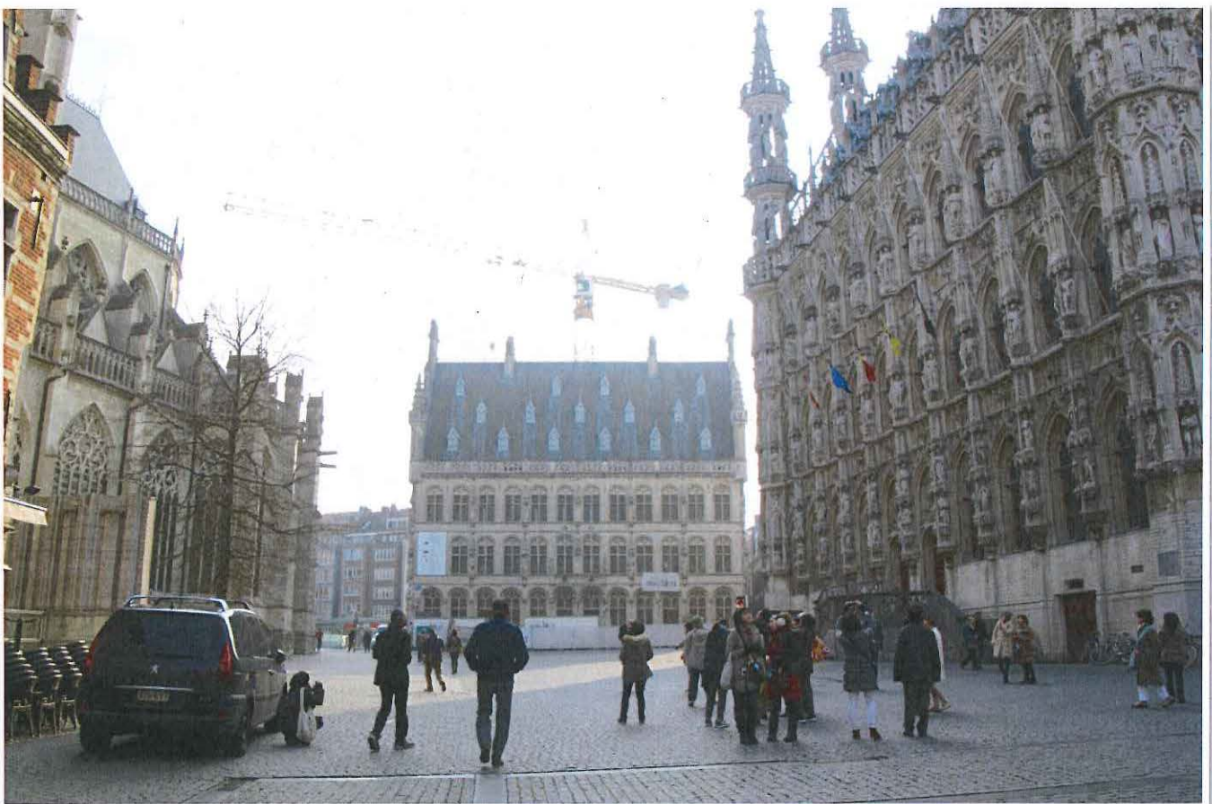
Foto 21: Leuven, Grote Markt - zicht op de oostelijke pleinzijde met het koor van de Sint-Pieterskerk (links), het Stadhuis (rechts) en het Tafelrond (centraal)