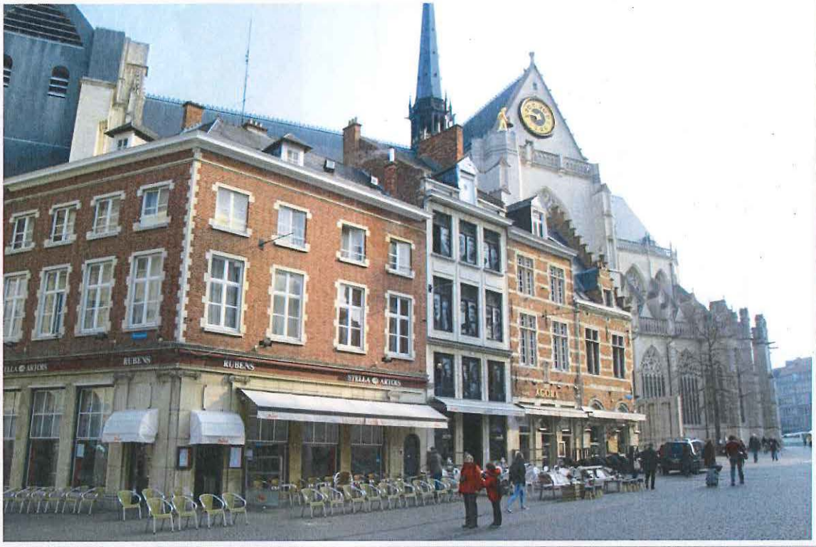
Foto 15: Leuven, Grote Markt - zicht op de noordelijke pleinwand met achterliggend de Sint-Pieterskerk