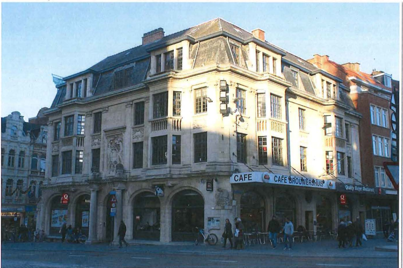
Foto 23: Leuven, Margarethaplein 12/Rector De Somerplein 1, Brouwershuis