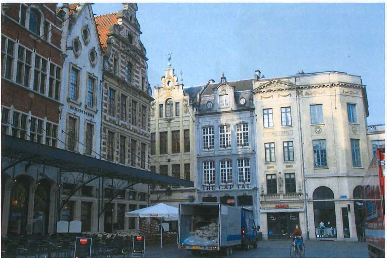
Foto 9: Leuven, Grote Markt - zicht op een deel van de zuidelijke pleinwand (links) en de westelijke pleinwand (centraal)