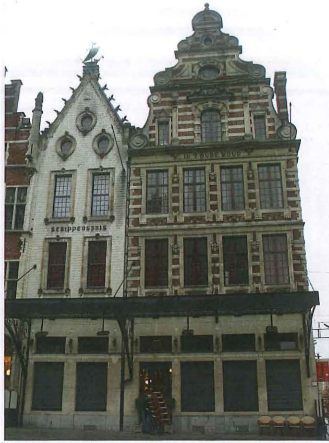
Foto 8: Leuven, Grote Markt 13, Het Schippershuis (links) en In 't Oude Woud (rechts), heden Café Gambrinus