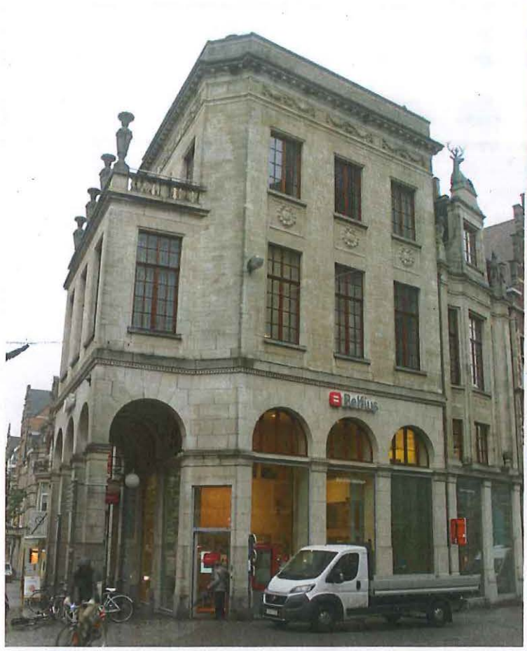
Foto 12: Leuven, Brusselsestraat 2, Hoekpand en Saint Hubert (rechts)