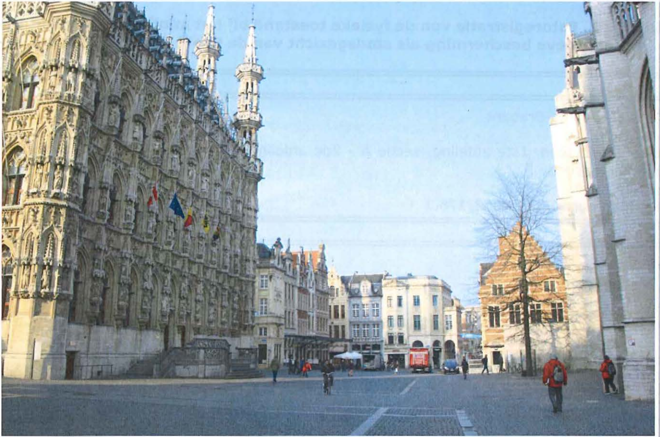
Foto 1: Leuven, Grote Markt - zicht op de zuidelijke pleinzijde met stadhuis (links)