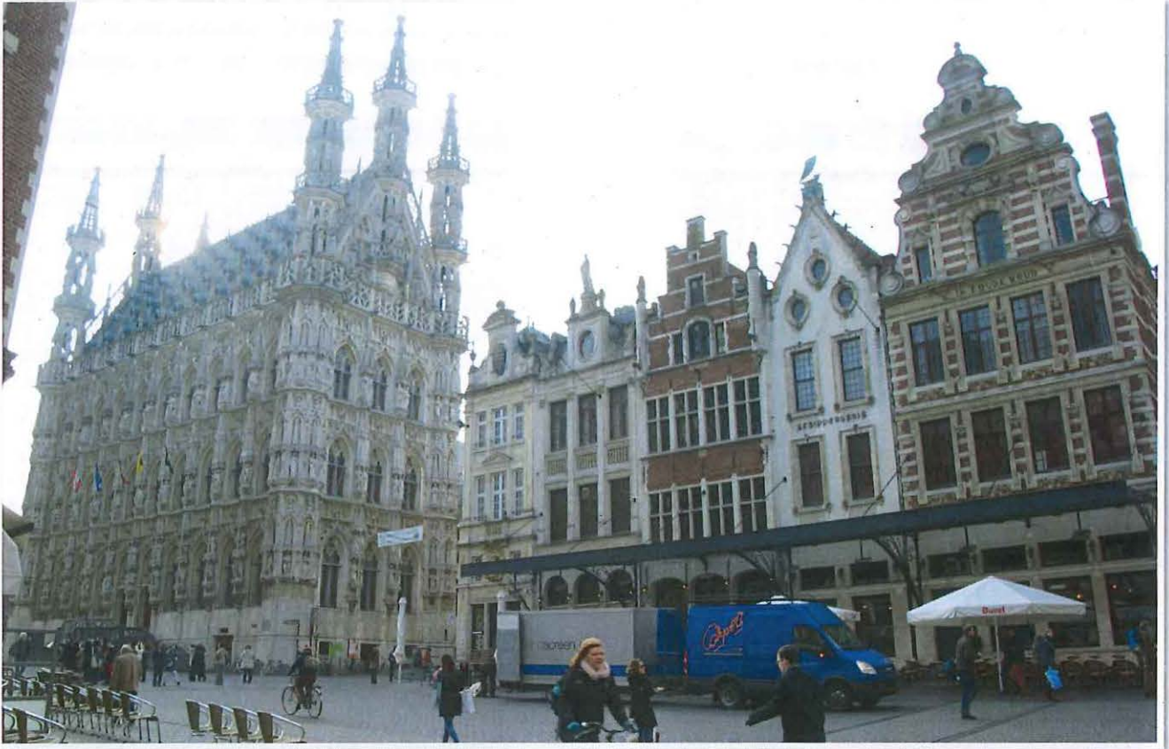
Foto 3: Leuven, Grote Markt - zicht op de zuidelijke pleinwand met het stadhuis (links)