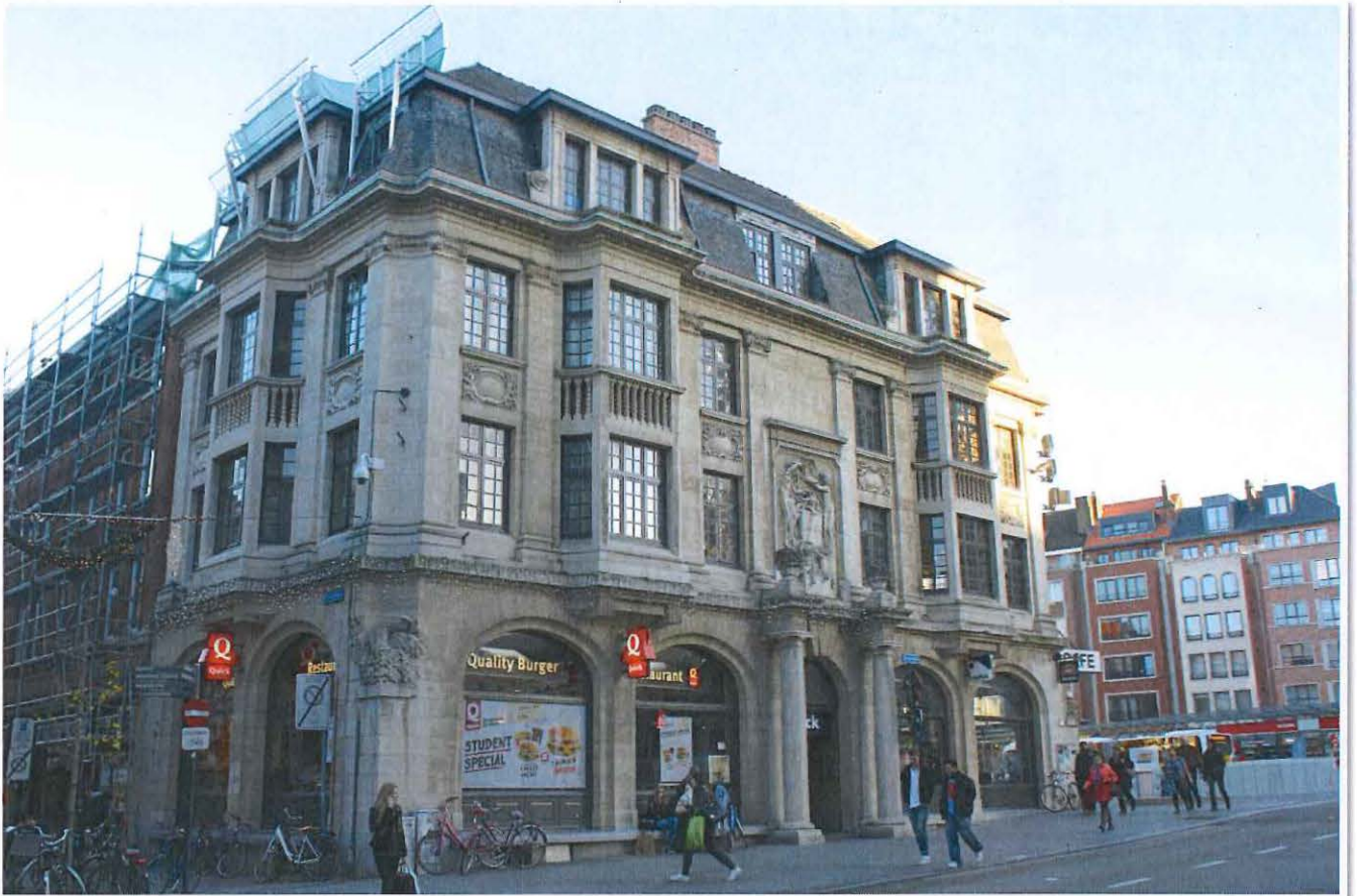
Foto 24: Leuven, Margarethaplein 12/Rector De Somerplein 1, Brouwershuis