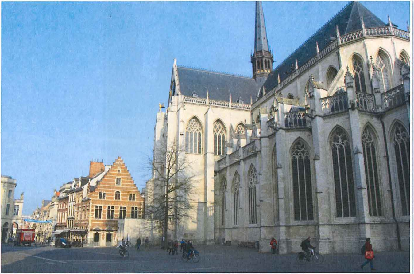
Foto 20: Leuven, Grote Markt - zicht op de Sint-Pieterskerk en de noordelijke pleinwand