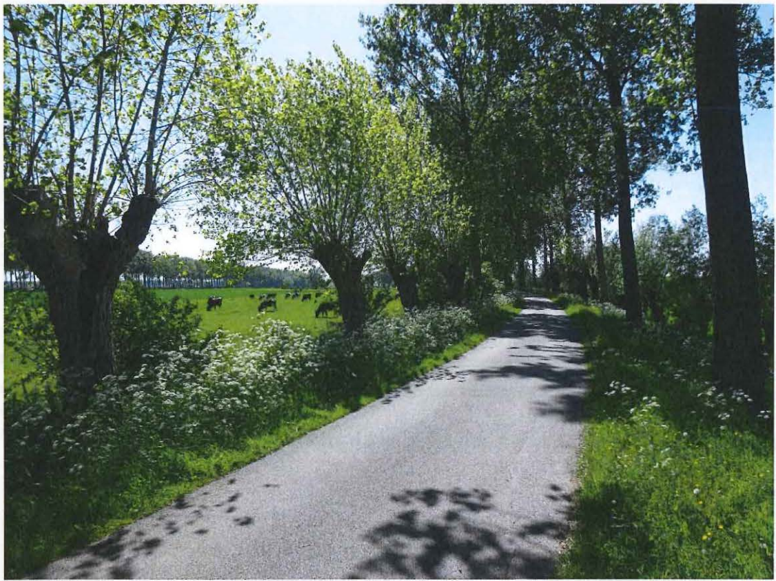
Foto 2: Opgaande populierenrijen en knotbomen langsheen de Krinkeldijk