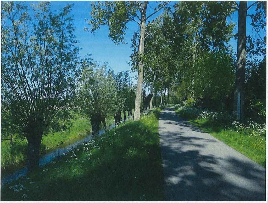
Foto 3: Knotbomen en opgaande populierenrijen langsheen de Krinkeldijk