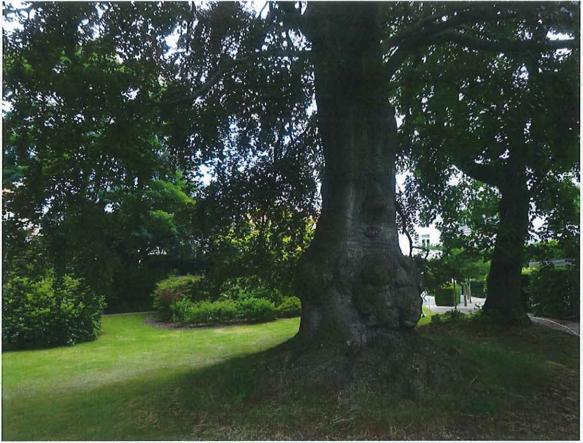
Foto 4: algemeen zicht op stadstuin met geënte bruine beuk en tulpenboom